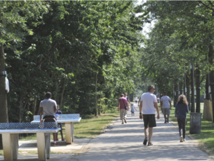
Place du Clos Saint-Georges

Conçue au cœur d'un quartier paisible et verdoyant, Bucolia vit au rythme des saisons du parc de Guermantes, situé à 5 minutes de la résidence et du Golf de Bussy-Guermantes. Cadre privilégié, ce quartier résidentiel accueille essentiellement des jolis pavillons pour les familles, à moins de 10 minutes du centre-ville et de sa gare.