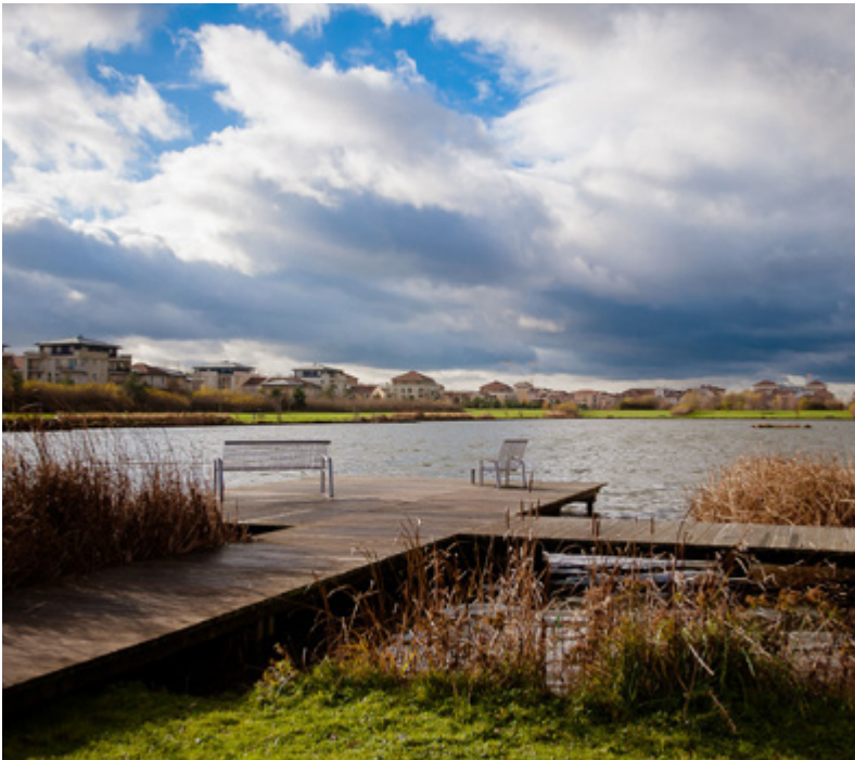
Parc du Génitoy

Du centre-ville et de ses nombreux commerces en passant par le nouvel éco-quartier en construction ou par le quartier du Clos Saint-Georges, la commune se réinvente au rythme des attentes de ses habitants en recherche de la nature en ville.