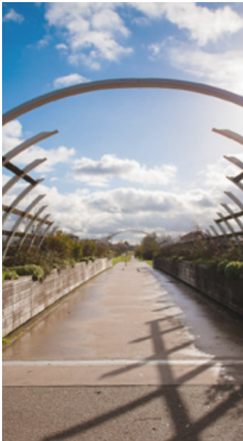
Passerelle du Nautilus